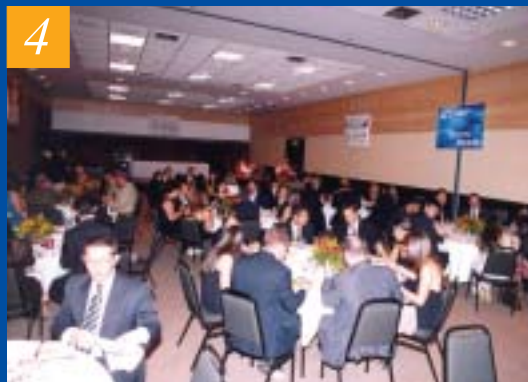
4 – O JANTAR E A ENTREGA DOS PRÊMIOS OCORRERAM NUM AMPLO E BEM MONTADO SALÃO. MAIS DE 100 PESSOAS ESTIVERAM PRESENTES AO EVENTO