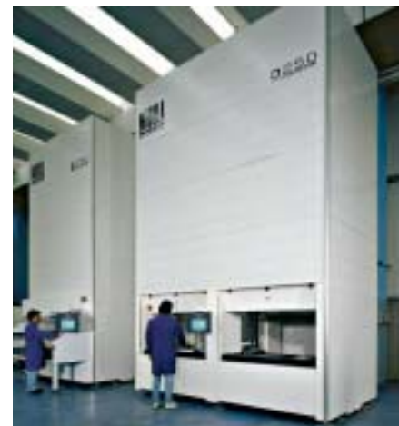
O MÓDULO, UM DOS PRINCIPAIS PRODUTOS DA SYSTEM GROUP, É UTILIZADO POR GRANDES EMPRESAS INTERNACIONAIS E É UM SUCESSO, DEVIDO À SUA SOFISTICADA TECNOLOGIA

Toda empresa passa por dificuldades, com a System não foi diferente. Porém, no Brasil, as dificuldades ficaram limitadas aos momentos de crise cambial. A empresa é formada por três divisões, System Ceramics, System Electronics e System Logistics, portanto é muito difícil todas as áreas apresentarem crise ao mesmo tempo.