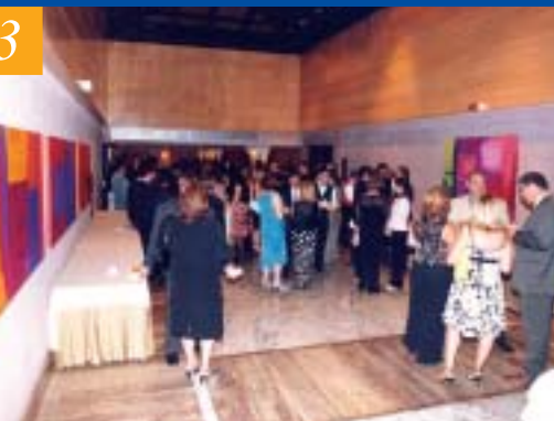
3 – A FESTA DE FINAL DE ANO DESTA VEZ FOI REALIZADA NO BLUE TREE TOWERS DA AVENIDA IBIRAPUERA, HOTEL COM INSTALAÇÕES MUITO AGRADÁVEIS