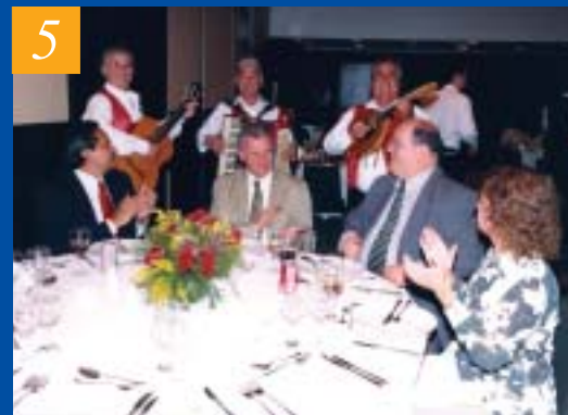
5 – UM GRUPO DE TROVADORES PASSOU DE MESA EM MESA, APRESENTANDO MÚSICAS QUE ENCANTARAM A TODOS OS PRESENTES, QUE APLAUDIRAM INTENSAMENTE OS MÚSICOS