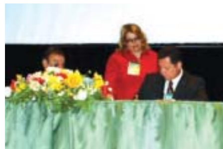
O PRESIDENTE DO CONSELHO DE ADMINISTRAÇÃO DA ABML ASSINA O TERMO DE COOPERAÇÃO COM A OPET DE CURITIBA, CIDADE QUE TERÁ TAMBÉM NÚCLEO DA ABML

empresarial paranaense, e com isso tornar possível aumento na qualidade e produtividade nas operações logísticas e de movimentação das empresas.