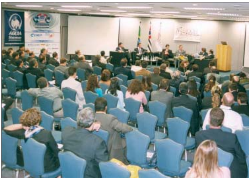
CASA CHEIA: CONTEÚDO DO CONGRESSO MAIS UMA VEZ SATISFEZ AO PÚBLICO PRESENTE