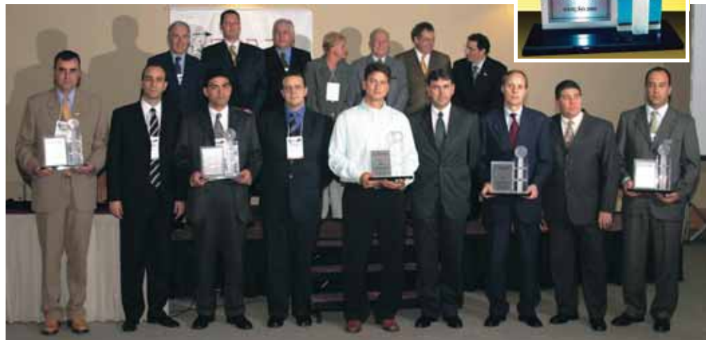
PRÊMIO CHEGA À QUINTA EDIÇÃO E INCORPORA CATEGORIA UNIVERSITÁRIOS

Neste ano, a coordenação do Congresso preparou inovações também na parte de conteúdo,