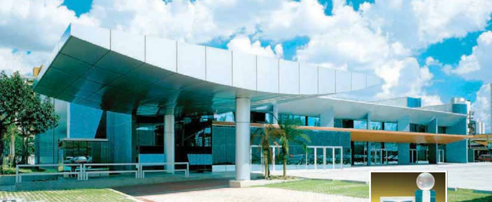
EVENTO DE 2004 SERÁ REALIZADO NA AMCHAM, QUE TEM EXCELENTE LOCALIZAÇÃO