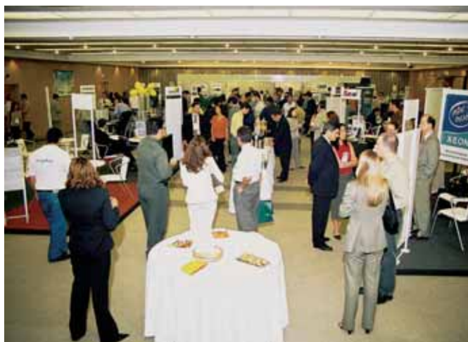
ABML EXPO DO ANO PASSADO FOI MUITO ELOGIADA PELO PÚBLICO

Os números do congresso de 2003 foram excelentes, principalmente pelo fato de o País estar vivendo forte recessão, falta de investimento, incerteza e falta de confiança. A expectativa para este ano é de sucesso maior, pois a logística, em que pese ainda as dificuldades econômicas, está sendo alvo de investimentos pesados em seus diversos setores.