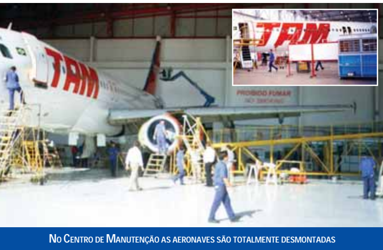
NO CENTRO DE MANUTENÇÃO AS AERONAVES SÃO TOTALMENTE DESMONTADAS

Todos os componentes do avião são retirados e examinados, inclusive o tubo da fuselagem, que é o que resta após o desmonte. O que é retirado é rigorosamente testado, peça a peça.