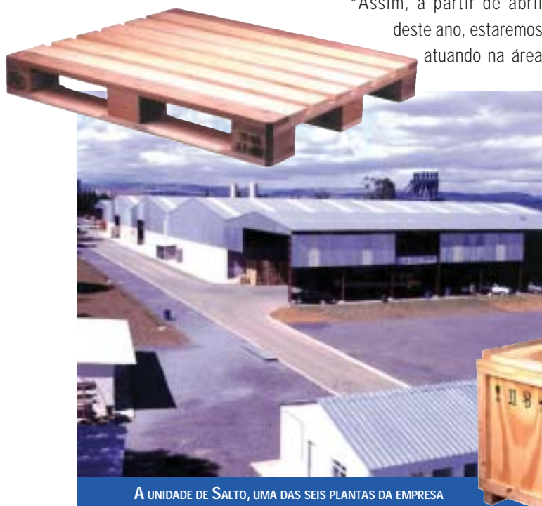
A UNIDADE DE SALTO, UMA DAS SEIS PLANTAS DA EMPRESA

A empresa conta com equipamento de alta tecnologia, com linha automatizada para montagem de paletes e, em parceria com operadores logísticos, tem capacidade de integrar todas as etapas em qualquer projeto de logística, desde o fornecimento de embalagens e paletes (descartáveis e retornáveis), processo de embalagem e acondicionamento, armazenagem e distribuição física, até despachos e desembaraço de cargas, importação e exportação.